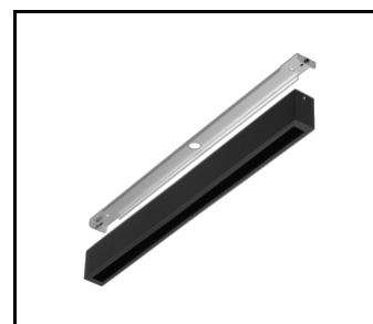
Terrano Oberfläche Rahmen schwarz matt RAL9005 573x38x60 (420948)

Erstellungsdatum der Karte: 01 April 2025