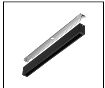
Terrano Oberfläche Rahmen schwarz matt RAL9005 573x38x60 (420948)

Erstellungsdatum der Karte: 02 Juni 2025