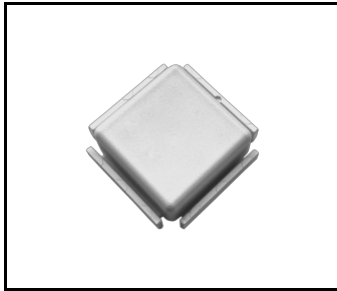
Terrano weißer Stecker (937408)