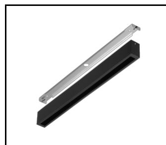
Terrano ramka natynkowa czarny mat RAL9005 573x38x60 (420948)