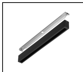
Terrano ramka natynkowa czarny mat RAL9005 573x38x60 (420948)