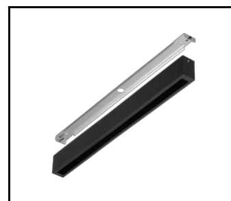
Terrano ramka natynkowa czarny mat RAL9005 573x38x60 (420948)