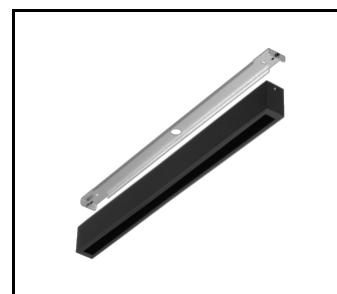
Terrano ramka natynkowa czarny mat RAL9005 573x38x60 (420948)