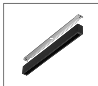
Terrano ramka natynkowa czarny mat RAL9005 573x38x60 (420948)