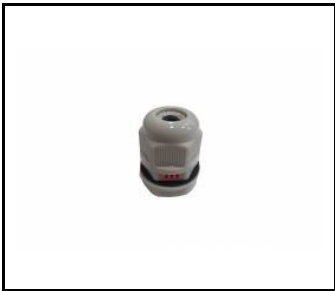
Divers presse-étoupe gris M20 * 1.5 IP68 (16000507)