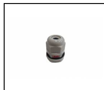
Divers presse-étoupe gris M20 * 1.5 IP68 (16000507)