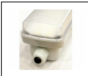
Blindstopfen für M16-Kabelverschraubung verschiedene PA schwarz M-16 – BPM-21 (60000006)

Erstellungsdatum der Karte: 19 August 2024