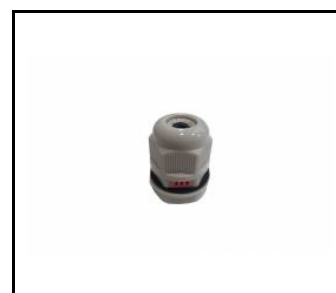
Drüse Entlüftung verschiedene grau M20*1.5 IP68 (16000507)