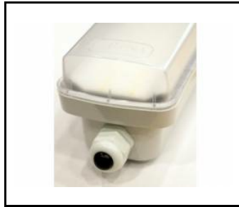
Blindstopfen für M16-Kabelverschraubung verschiedene PA schwarz M-16 – BPM-21 (60000006)

Erstellungsdatum der Karte: 05 August 2024