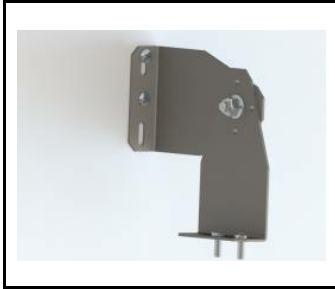
Halterung - TYTAN LED. INDUSTRY LED KOMPLET (2st.) (908200)