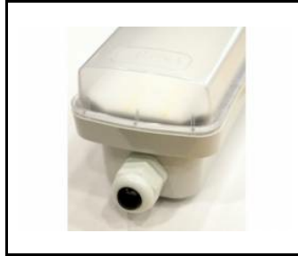
Blindstopfen für M16-Kabelverschraubung verschiedene PA schwarz M-16 – BPM-21 (60000006)

Erstellungsdatum der Karte: 05 August 2024