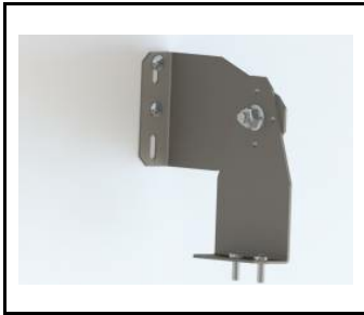
Halterung - TYTAN LED. INDUSTRY LED KOMPLET (2st.) (908200)