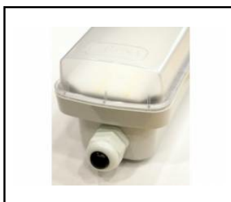
Bouchon presse-étoupe M16. divers PA noir M-16 - BPM-21 (60000006)

Date de création de la carte: 05 août 2024