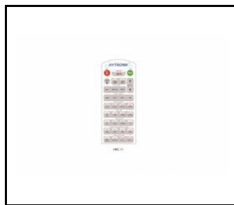
WSEL415 Télécommande pour capteur - PIR (WSEL415)

Date de création de la carte: 11 septembre 2024