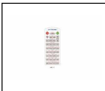
Pilot zdalnego sterowania do czujnika PIR (WSEL415)