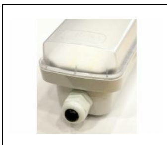
Blindstopfen für M16-Kabelverschraubung verschiedene PA schwarz M-16 – BPM-21 (60000006)

Erstellungsdatum der Karte: 19 August 2024