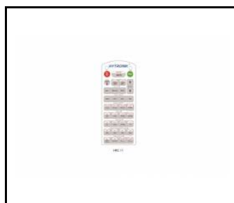
Pilot zdalnego sterowania do czujnika PIR (WSEL415)