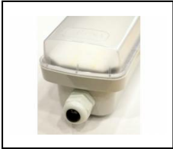
Bouchon presse-étoupe M16. divers PA noir M-16 - BPM-21 (60000006)