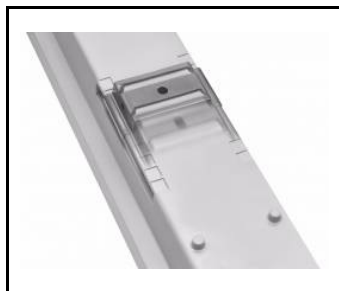
regulowane uchwyty / adjustable handles / einstellbare Halterungen