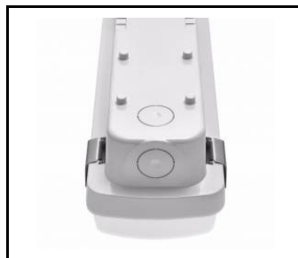
wybór miejsca zasilania / choosing a place of power supply / Stromversorgungsanschluss von mehreren Seite möglich