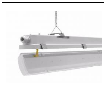
system zwieszania klosza / suspension system of the diffuser / hängende Diffusor