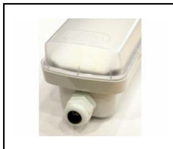
Blindstopfen für M16-Kabelverschraubung verschiedene PA schwarz M-16 – BPM-21 (60000006)

Erstellungsdatum der Karte: 19 August 2024