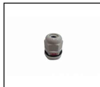
Divers presse-étoupe gris M20 * 1.5 IP68 (16000507)