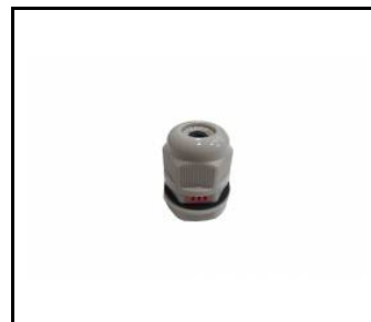
Divers presse-étoupe gris M20 * 1.5 IP68 (16000507)