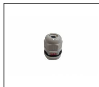
Dławnica odpowietrzająca różne szara M20*1.5 IP68 (16000507)