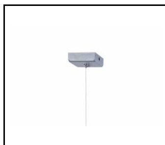
ZAWIEŚ POJEDYNCZY NOŚNY (puszka kwadratowa) (171642)