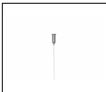
ZAWIEŚ POJEDYNCZY NOŚNY (171512)