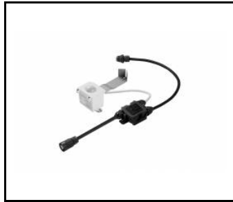
OCULUS LED - RCR / PIR DALI Bewegungsmelder (963674)

Erstellungsdatum der Karte: 08 Januar 2025