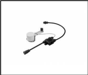
OCULUS LED MINI- Capteur RCR - complet (967054)