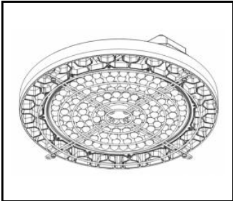
OCULUS LED - kit filet de sécurité (561382)

Date de création de la carte: 10 juillet 2025 Le fabricant se réserve le droit d'apporter des modifications au cours de l'amélioration du produit ainsi que des modifications de conception ou de modernisation du produit présenté. La fiche technique du produit n'est pas une offre commerciale * La tolérance des paramètres est de +/- 10 %