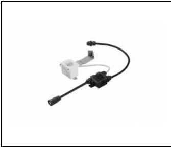
OCULUS LED MINI- Capteur PIR / RCR DALI complet (967047)