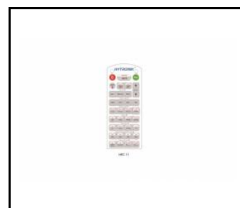
WSEL415 Bewegungs PIR-Sensor (WSEL415)