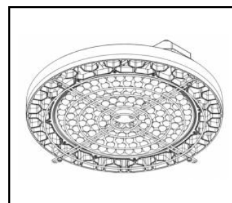
OCULUS LED- zestaw siatka ochronna (561382)